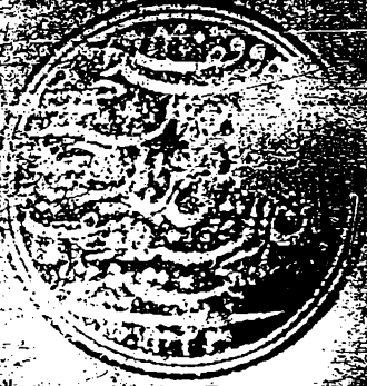
الورقة الأخيرة من النسخة ( أ )